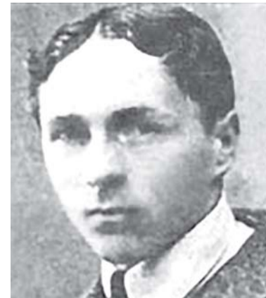
ГРИГОРІЙ ПІПСЬКИЙ, загинув у бою під Крутами