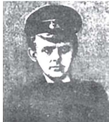
МИКОЛА ГАНКЕВИЧ, загинув у бою під Крутами