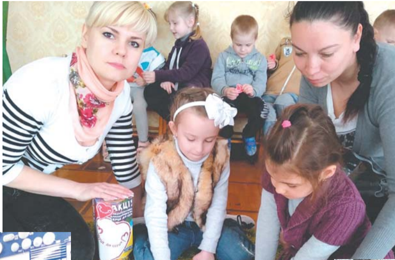
Подільського та небайдужих могилівчан вдалося зібрати 29188,9 грн., що, у порівнянні з минулим роком, більше на 6868,10 грн. (2018р.- 22 320,80 грн.) НВК № 3, сума збору склала – 4510,00 грн.

Вже 14 рік поспіль благодійна акція Всеукраїнського благодійного фонду «Серце до серця» збирає кошти для закупівлі обладнання у обласні дитячі лікарні країни.